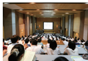
6 大視聴覚室 ●学科説明会(作業・放射) ●入試説明会

1 厚生棟 2 管理棟 3 中庭 4 図書館棟 5 講堂 6 校舎棟 7 テニスコート 8 アリーナ体育館 9 グラウンド