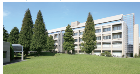
6 校舎棟 ●進学相談会 ●学生相談 ●模擬授業