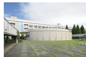
5 講堂 ●学科説明会(看護・理学) ●入試説明会